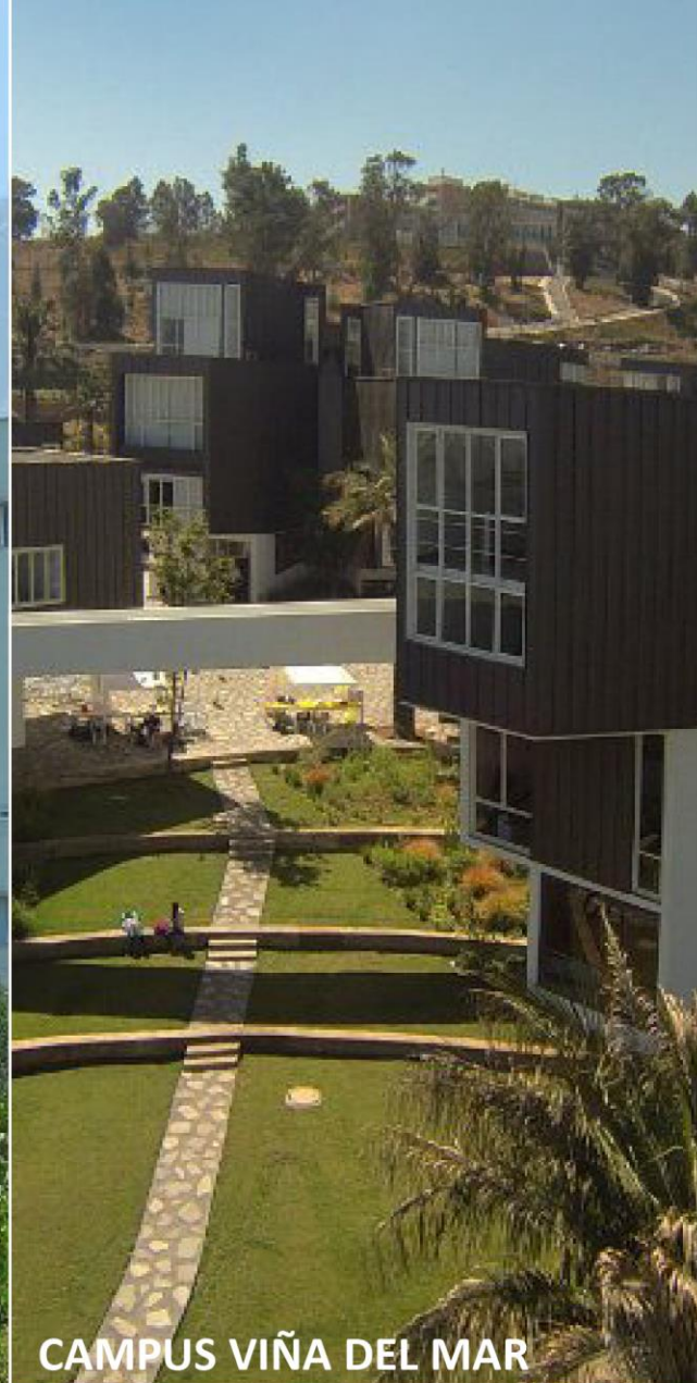
CAMPUS VIÑA DEL MAR

Av. Diagonal Las Torres 2640, Peñalolén, Santiago (Chile)