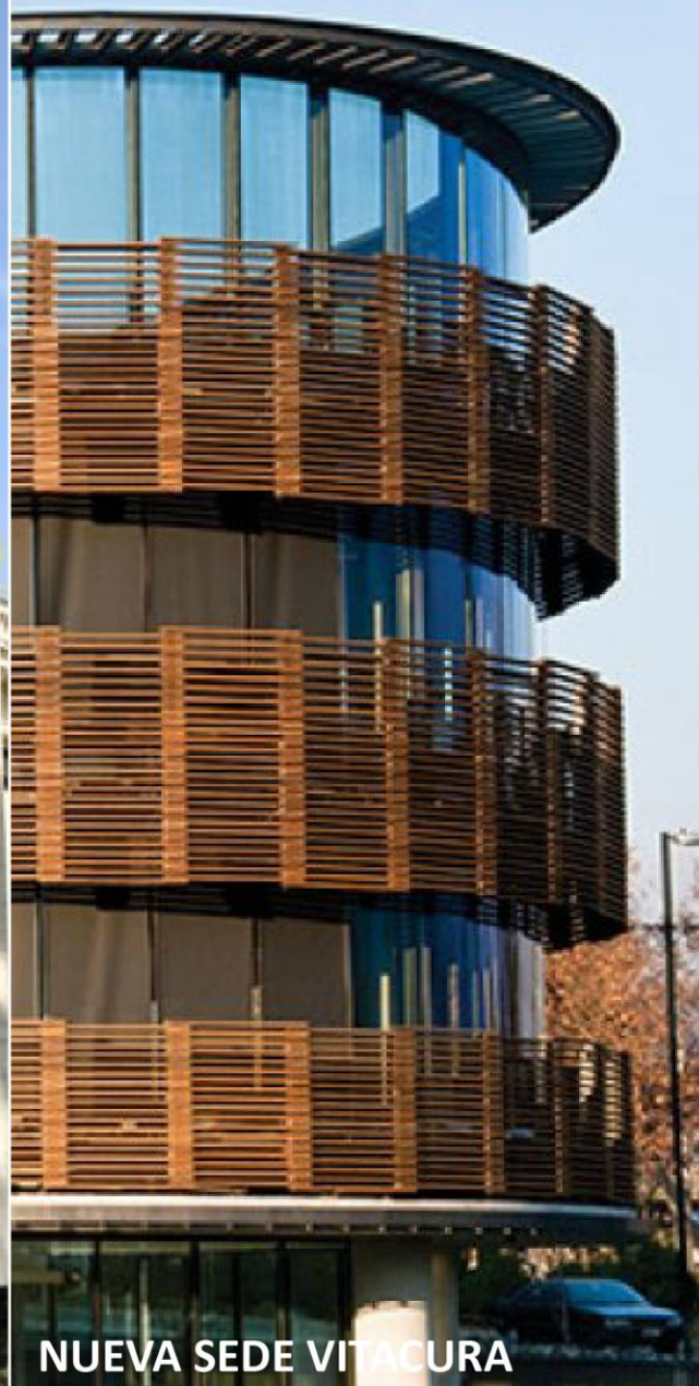
NUEVA SEDE VITACURA

Av. Presidente Errázuriz 3485, Las Condes, Santiago (Chile)